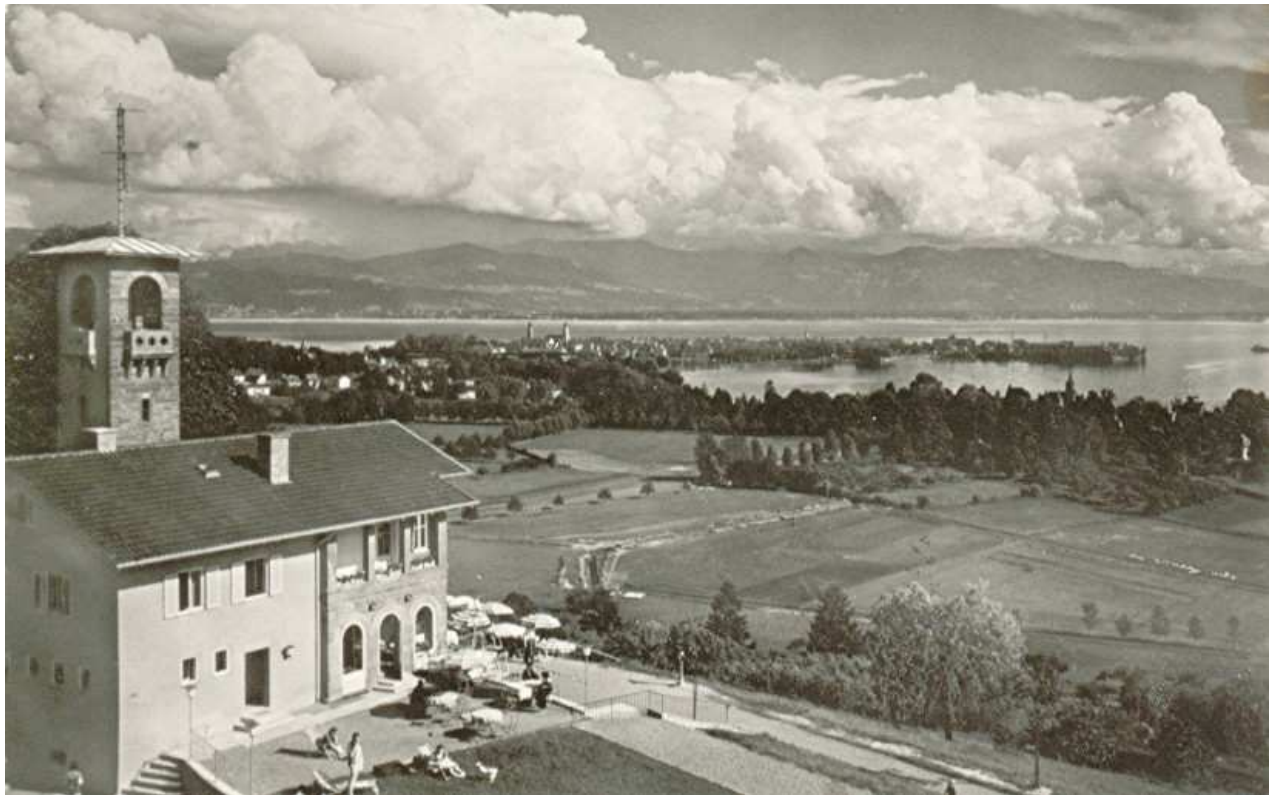
Blick auf das Restaurant Hoyerbergschlösschen und auf Lindau auf einer Postkarte mit dem Poststempel 10. August 1960. Sammlung Schweizer.

Selbst während der finsternen Jahre von Faschismus und 2. Weltkrieg schrieb WOERL's Reisetagebuch 1941 in Leipzig für jene, die noch Urlaub machen durften: „Hoyerberg (465 m; 70 m über dem Bodensee). Der lohnenste Spaziergang im Lindauer Stadtgebiet! Prachtvolle Aussicht! ...Oben Kaffeegaststätte, eiserne Aussichtsplattform mit Orientierungstafel und die 1908 gepflanzte Lingg-Linde.“