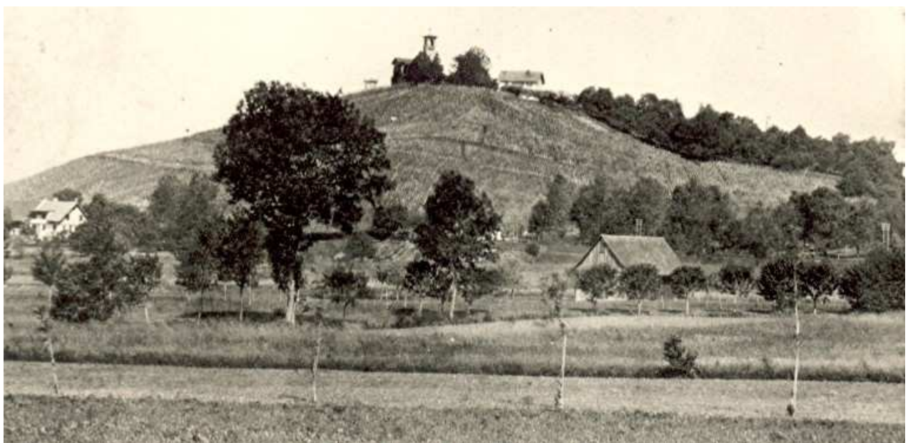
Blick auf die mit Weinreben bewachsene Südseite des Hoyerbergs in Lindau-Hoyern auf einer Postkarte aus dem Jahr 1887.

Mitten im 1. Weltkrieg bot sich für die damals noch selbständige Landgemeinde Hoyren die Gelegenheit zum Erwerb von Schlösschen samt Grundstück. Eine öffentliche Gemeindeversammlung am 13. Dezember 1917 sollte darüber entscheiden. Das Lindauer Tagblatt berichtete dazu: „In der gestern Abend in der ‚Sonne‘ in Hoyren stattgefundenen Gemeinde-Versammlung wurde einstimmig beschlossen, den Gruber`schen Grundbesitz samt Schlösschen und ‚Aussichtsturm‘ auf dem schön