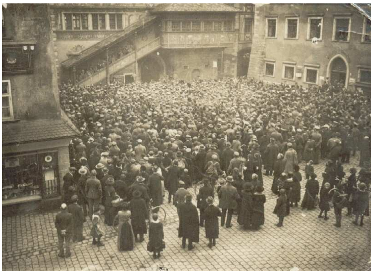
Revolutionskundgebung am 9. 11. 1918 vor dem Lindauer Rathaus.