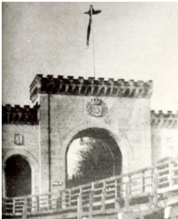
Das Lindauer Landtor mit der roten Fahne zur Zeit der Räterepublik im April 1919.

zuzuweisen. Haushalte, meist in besseren Wohngegenden, wurden nach gehorteten Lebensmitteln und Kohlevorräten durchsucht und das Gefundene öffentlich verteilt. Der Soldatenrat beschloss unter Leitung seines 1. Vorsitzenden, Gefreiten Miller, das Offiziers-Kasino zu einem Privathaushalt zu erklären und ihm dadurch bisherige Versorgungsprivilegien zu nehmen. Die Standort-Schlächtereier wurde erst kontrolliert und später zugunsten der örtlichen Metzgereien aufgelöst. Die zuvor adeligen Namen der in Lindau