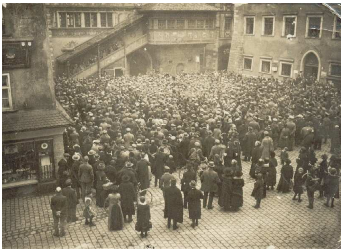
Revolutionskundgebung am 9. 11. 1918 vor dem Lindauer Rathaus.