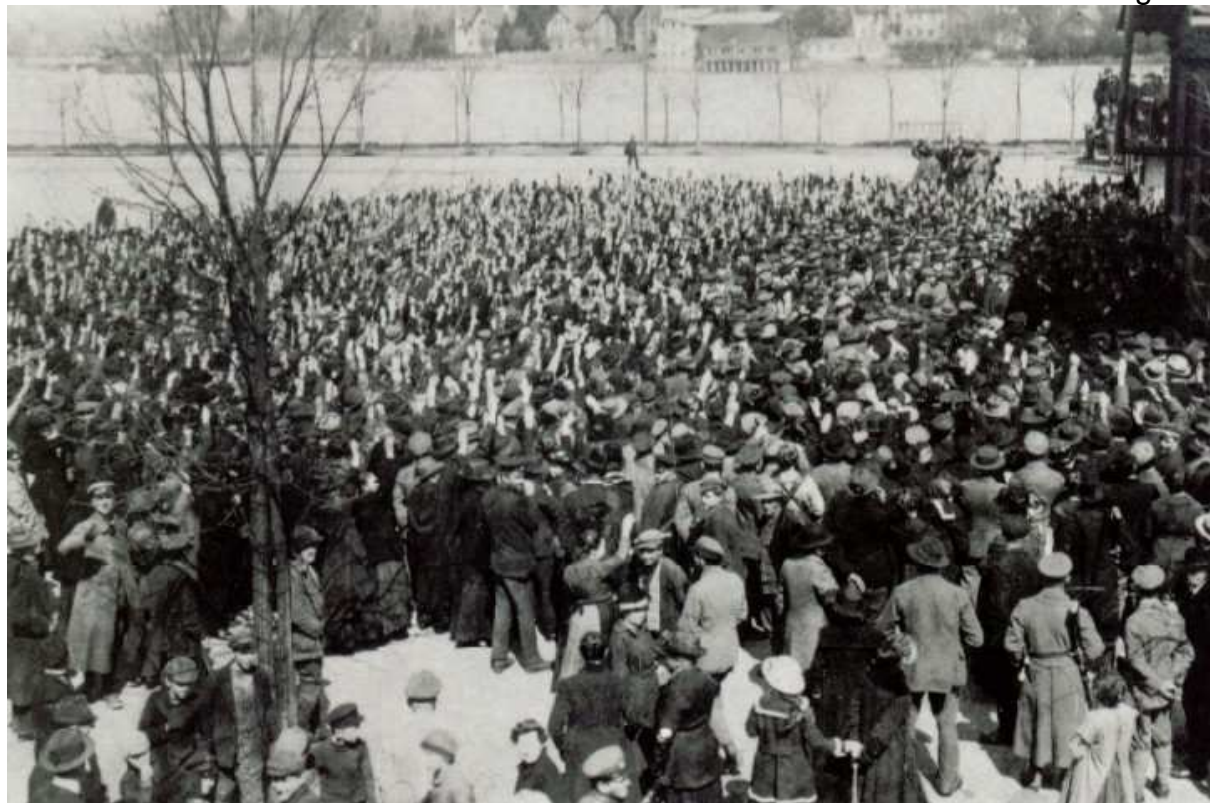
Abstimmung der Bevölkerung der Inselstadt Lindau am 19. April 1919 über das Ende der Räterepublik Lindau.

Rommel traf sich daraufhin mit Rätevertretern in der Mitte der Brücke. Nach langen