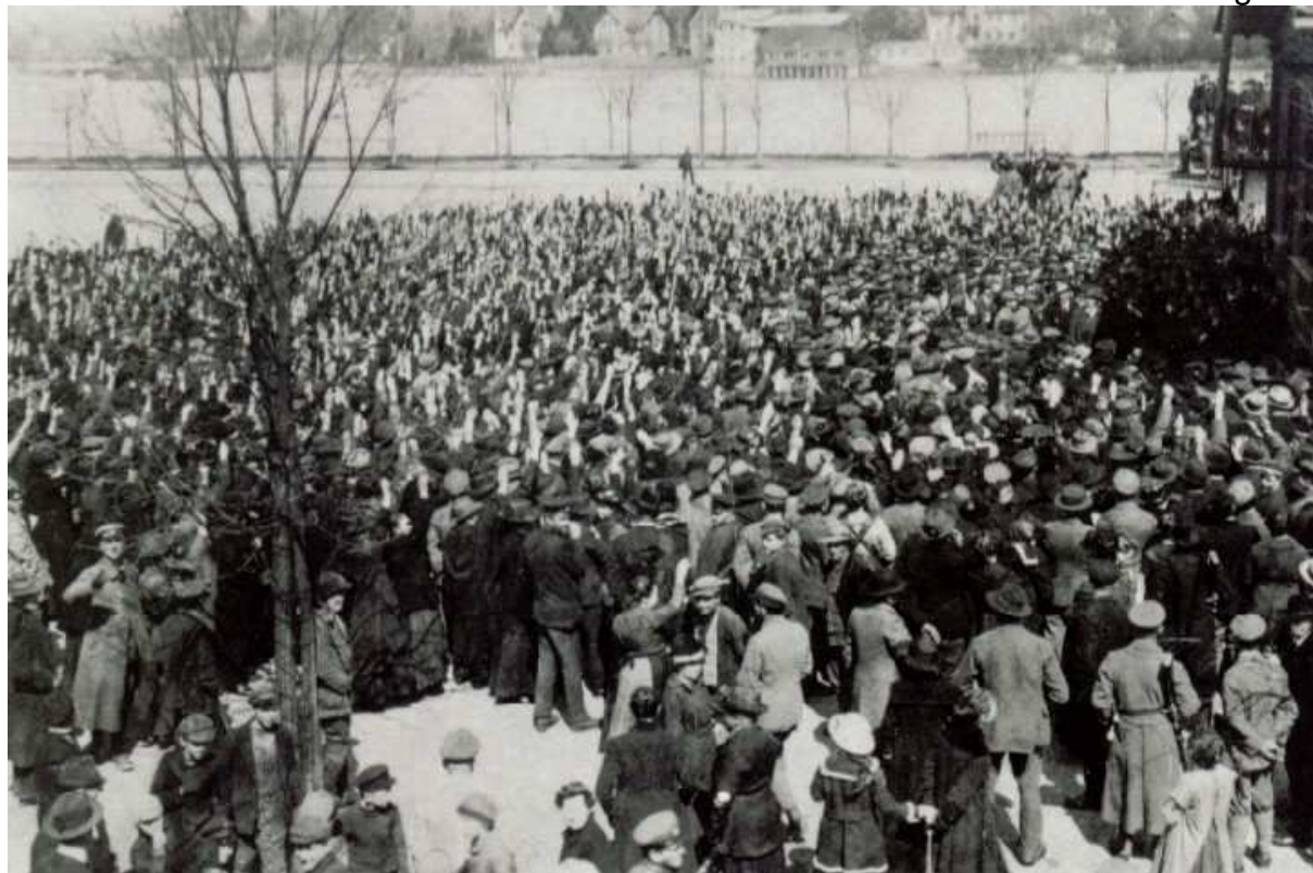
Abstimmung der Bevölkerung der Inselstadt Lindau am 19. April 1919 über das Ende der Räterepublik Lindau.

„Wüstenfuchs“, mit zwei Sicherheitskompanien der Garnison Weingarten/Friedrichshafen gegen das revolutionäre Lindau zu ziehen. Zur Ausrüstung gehörten zwei Boote, zwei schwere Maschinengewehre und ein von den Zeppelin-Werken gestellter LKW. Zeppelin betrieb seit 1917 unter Claude Dornier auch in Lindau eine Flugzeugproduktion in den Räumen der heutigen Sulzer-Escher-Wyss und im Zech. Doch mehr als die Hälfte der württembergischen Soldaten weigerte sich, gegen die Arbeiter in Bayern zu ziehen. Unterstützung erhielt Rommel hingegen bei einem heimlichen Vorabbesuch in der Inselstadt aus Kreisen des örtlichen Bürgertums und der Bauernschaft des Umlandes zugesagt. Mit zusätzlichen 180 Sturmgewehren für die versammelten rund 300 Bauern und Gewerbetreibenden marschierte er in der Nacht zum 19. April vor die Insel. Weiter kam er nicht, denn zwei Friedrichshafener Arbeiter hatten sich zuvor per Rad nach Lindau aufgemacht und die hiesigen Räte gewarnt. Das Landtor wurde geschlossen, revolutionäre Lindauer Soldaten bezogen mit Maschinengewehren auf der Brücke, dem Bahndamm und am Hafen Posten und hielten Rommels Boote auf Distanz. Von Reutin aus rückten bei Tagesanbruch rund 300 bewaffnete Arbeiter als „Rote Garde Reutin“ gegen die konterrevolutionären Truppen an. Rommel traf sich daraufhin mit Rätevertretern in der Mitte der Brücke. Nach langen