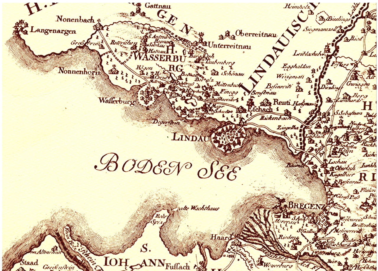
Lindau und die Bregenzer Bucht auf der Vorarlberg-Karte „Provincia Arlbergica“ des Blasius Hueber von 1783, Ausschnitt aus Blatt Nord/Bregenz. Original im Vorarlberger Landesmuseum Bregenz; Repro: Schweizer.

Jüdinnen und Juden durften damals im christlichen Mitteleuropa weder Landwirtschaft noch ein Handwerk betreiben oder an den wenigen christlichen Universitäten studieren. Zwangsläufig mussten sie sich beruflich bei Beachtung der christlichen Vorschriften und Feiertage auf Handel, Geld- und Pfandleihe konzentrieren, wofür sie dann wiederum oft geschmäht und verfolgt wurden.