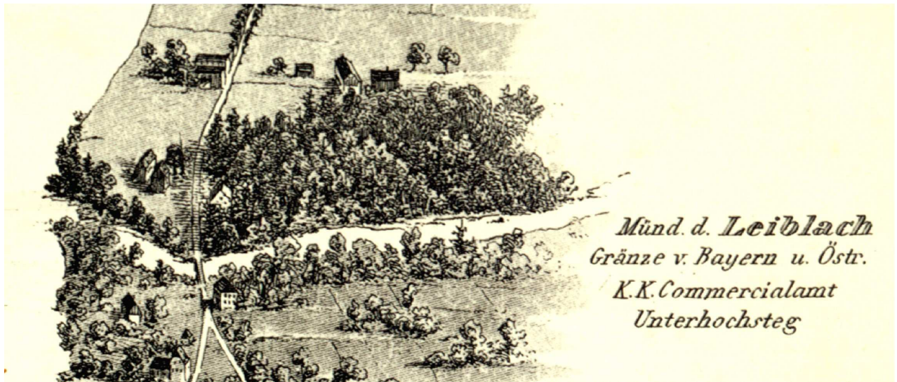
Der Grenzübergang mit der bayerischen Grenzstation Zech-Unterhochsteg über die Laiblach auf der Bodensee-Panoramakarte von A. Brandmayer im Jahre 1840.

Bad Buchau am Federsee stammende Samuel Josef. Laut seinem für sechs Monate gültigen Reisepass vom April 1815 belieferte der damals 50-Jährige mit seinen Waren innerhalb sechs Monaten fußläufig auf drei „Medinen“ von Dornbirn aus Kunden in Schaffhausen, Zuzach, Hechingen, Biberach, Babenhausen, Burgau, Fürth,